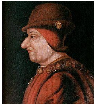
2) Людовик XI