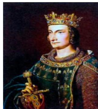
3) Филипп IV Красивый