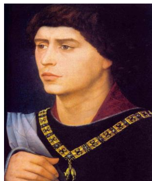
2) Карл Смелый (Бургундский)