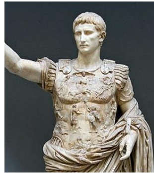
3) Октавиан Август