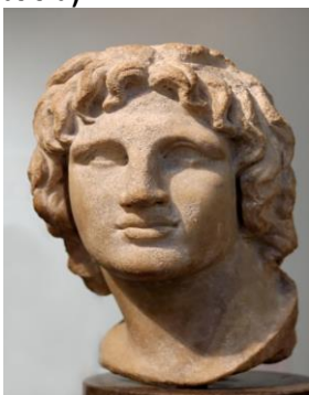
1) Александр Македонский

1. Кто изображён на каждом портрете? Запишите ответы под портретами. (за каждый верный ответ 3 балла)